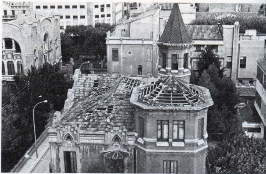
Foto autènticament reveladora i denunciadora del greu atac que ha sofert la Casa d'en Lluvià. L'estat de la teulada és desastrós. Les teules han estat tretes expressament per facilitar el deteriorament de la casa.

Tant de bo que aquestes fotos serveixin perquè això es pugui evitar. Tant de bo que serveixin perquè l'Ajuntament —que fins ara no ha intervingut en aquesta qüestió— prengui de seguida mesures acceptables que permetin de salvar dins el possible aquest edifici. Tant de bo que serveixin, almenys, per evitar que això mateix pugui succeir en d'altres edificis també històrics i importants. ● PAU PINIELLA