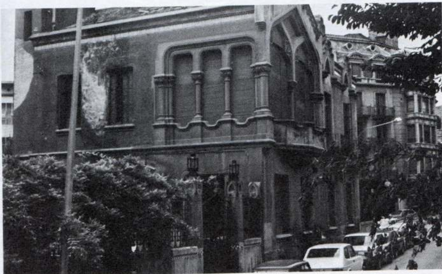
Vista parcial de la Casa d'en Lluvià. Es poden observar les conseqüències de la humitat.

Aquest títol segurament que cridarà l'atenció de diversa gent, però interessarà sobretot aquells que estan acostumats a especular amb els terrenys i que més d'una vegada s'hauran trobat amb alguna d'aquestes “casotes” que els entesos consideren que tenen valor històric i que els frustra els projectes.